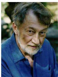
Bernard FAIVRE D'ARCIER - A ZSÚRI ELNÖKE

A legjobbaknak járó elismerés odaítélését 2012-ben is az operavilág és az európai kulturális élet kimagasló személyiségeiből álló nemzetközi zsűri végzi.